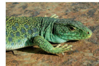
Lézard ocellé ( Lacerta lepida )